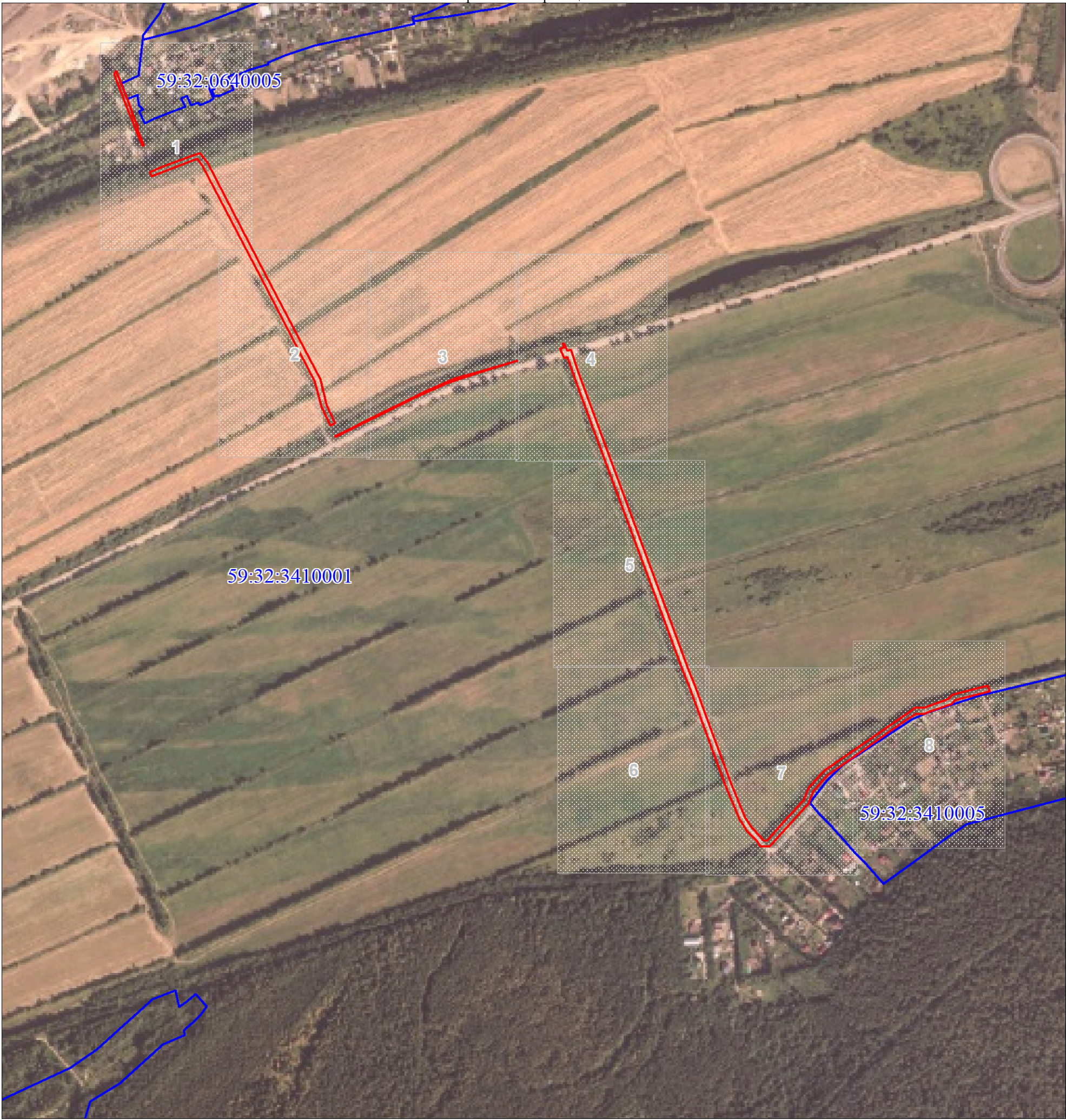
Обзорная схема границ объекта